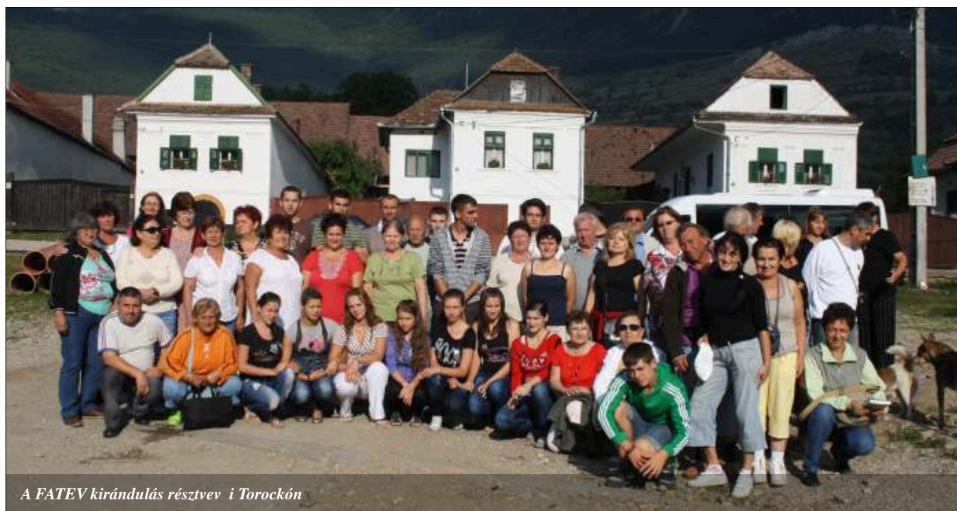
A FATEV kirándulás résztvevői Torockón