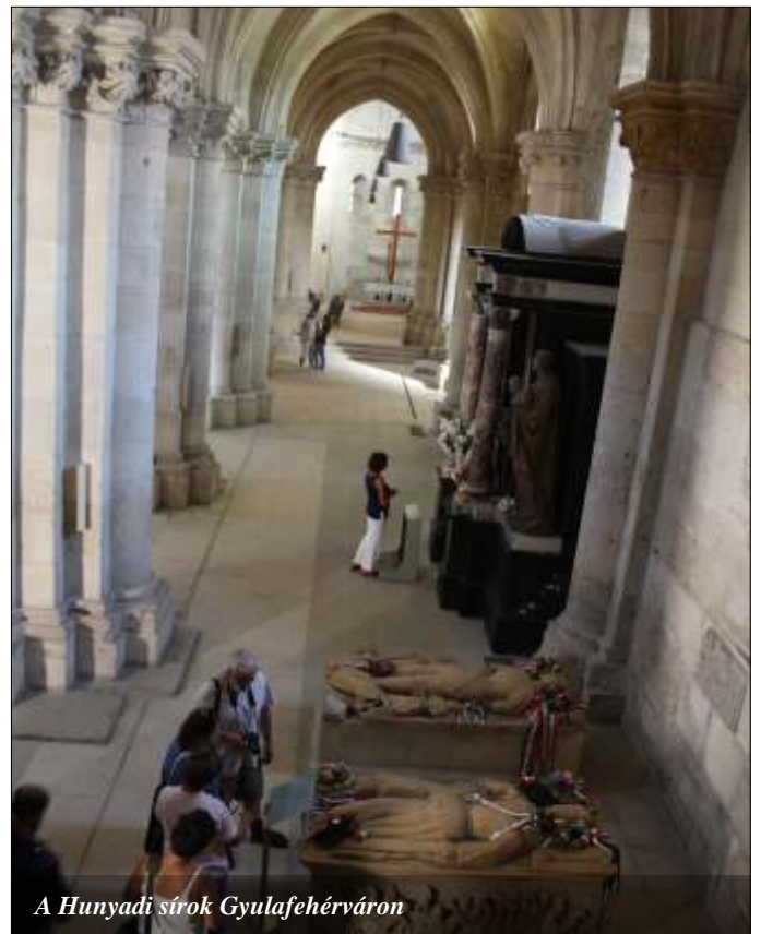
A Hunyadi sírok Gyulafehérváron