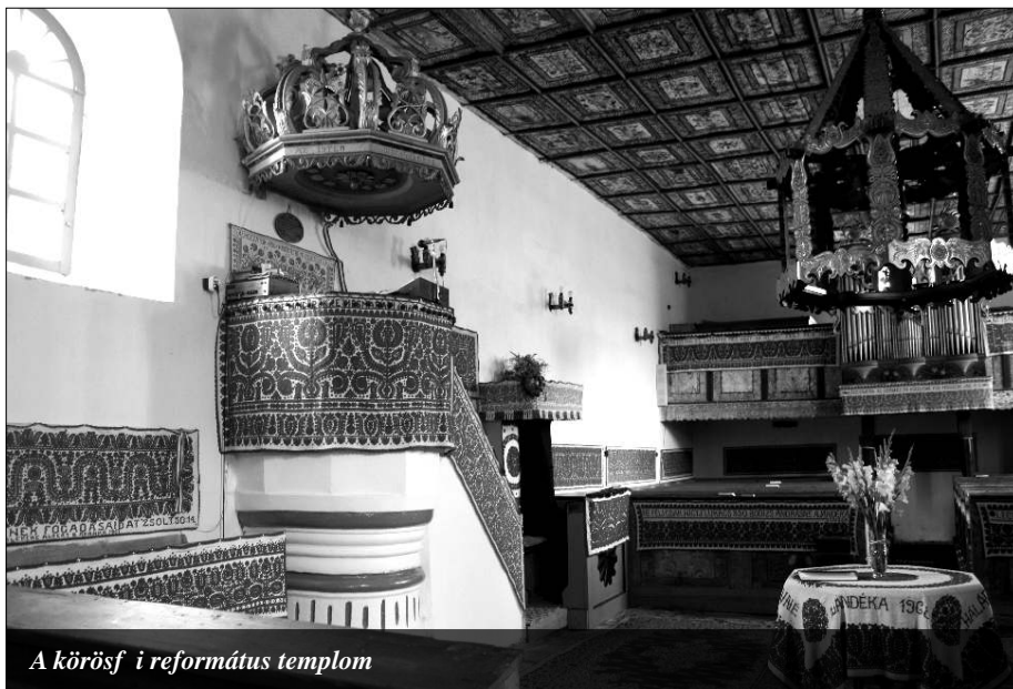
A körösfői református templom