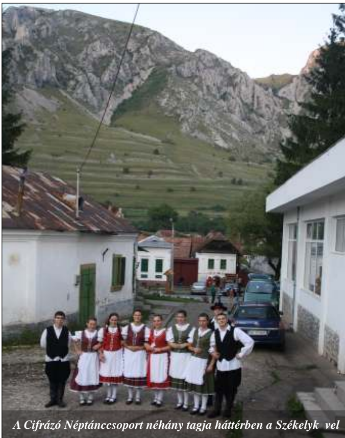
A Cifrázó Néptáncsoport néhány tagja háttérben a Székelyvel

A délután további része a honfoglalástól az erdélyi gyulák (hadvezérek) székhelyeként ismert Gyulafehérvár megismerésével telt. A város nevezetes-