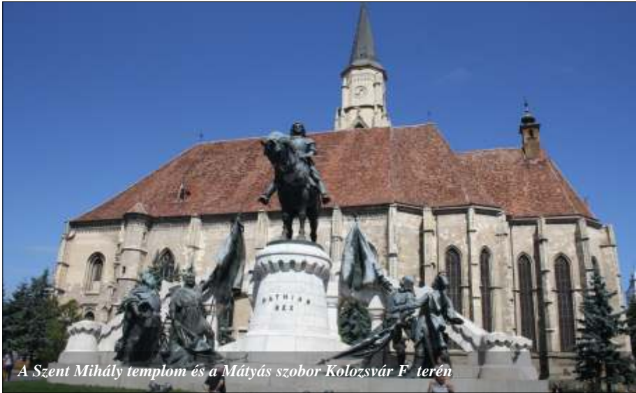
A Szent Mihály templom és a Mátyás szobor Kolozsvár F. terén