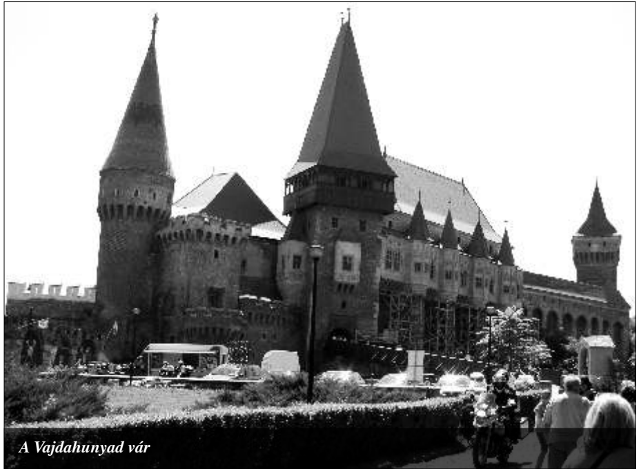
A Vajdahunyad vár

A kirándulás negyedik napján, a kétórás utazással elért Verespatak földalatti bányamúzeumának római kori tárnáiban járva világossá vált: a csillogó arany kitermelésének vannak természet- és környezetvédelmi következményei. Majd a rosszból lévén település utcács-